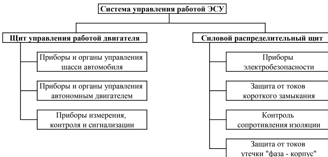
Структура системы управления работой ЭСУ АГ

Структура системы управления работой ЭСУ показана на рисунке.